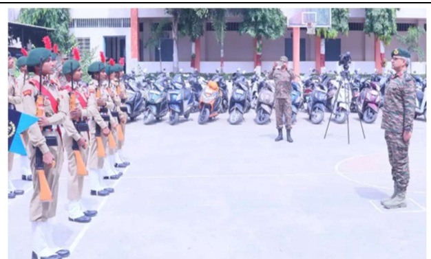
Guard of Honor by Cadets NCC Units (Girls/Boys), RSML.