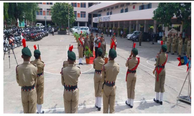
Guard of Honor by Cadets NCC Units (Girls/Boys), RSML.