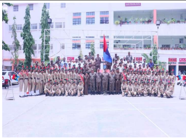
Group Photo with ANO and NCC Cadets

D) Copy of Brochure Prepared for the Program: NIL