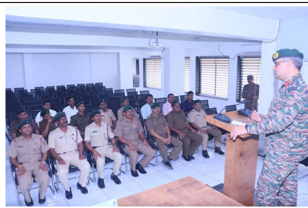
ANOs/CTOs from 53 Mah BN NCC Latur