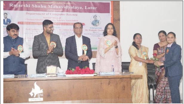
Felicitation of "TechnoMinds" (CSA) Office Bearers