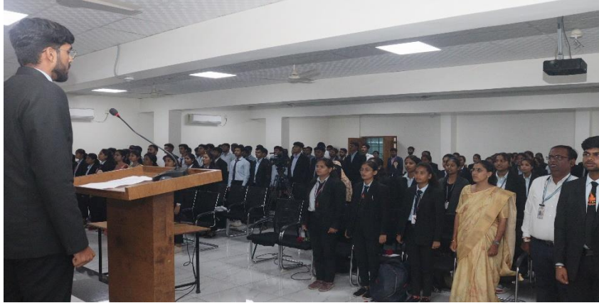
Concluding the Inaugural Ceremony with the National Anthem