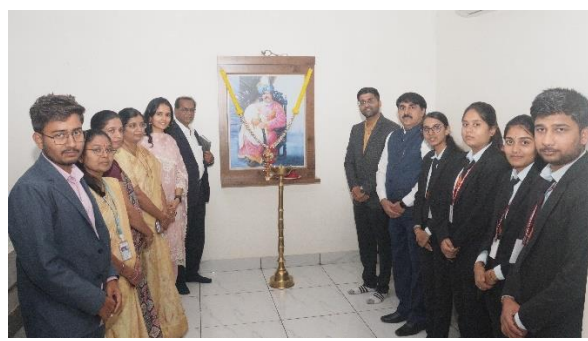
Ceremonial Lamp Lightening by Dignitaries