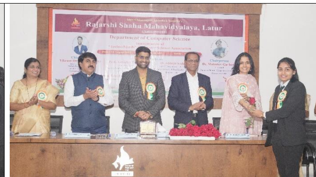
Felicitation of "TechnoMinds" (CSA) Office Bearers