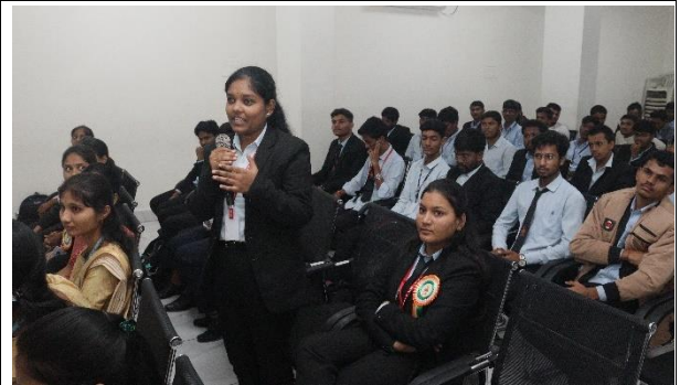
Students Actively Responding During the Session