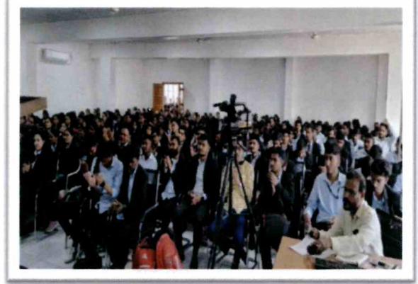
मुलाखतीस उपस्थित प्राध्यापक व विद्यार्थी

D) Link of Video of the programme if any (Video may be uploaded on college website/ YouTube, etc.) https://youtu.be/hTBOL9WhvK8?feature=shared